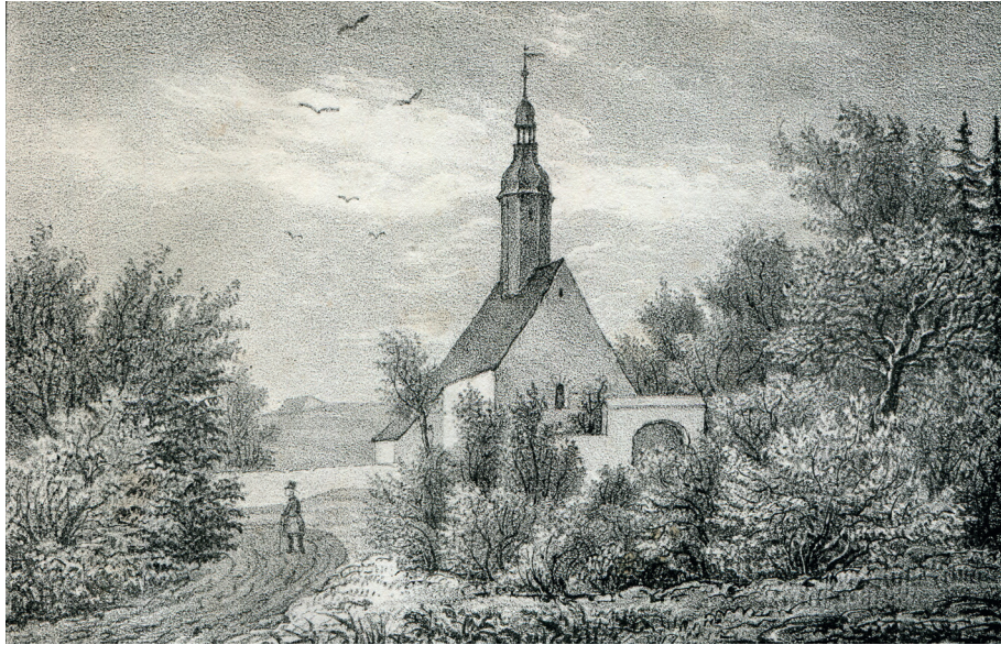
Dorfkirche Altgeringswalde um 1840