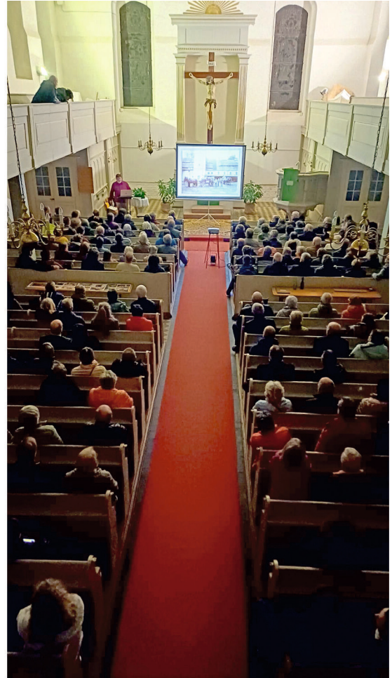
Vortrag zur Gersdorfer Ortsgeschichte am 23. März