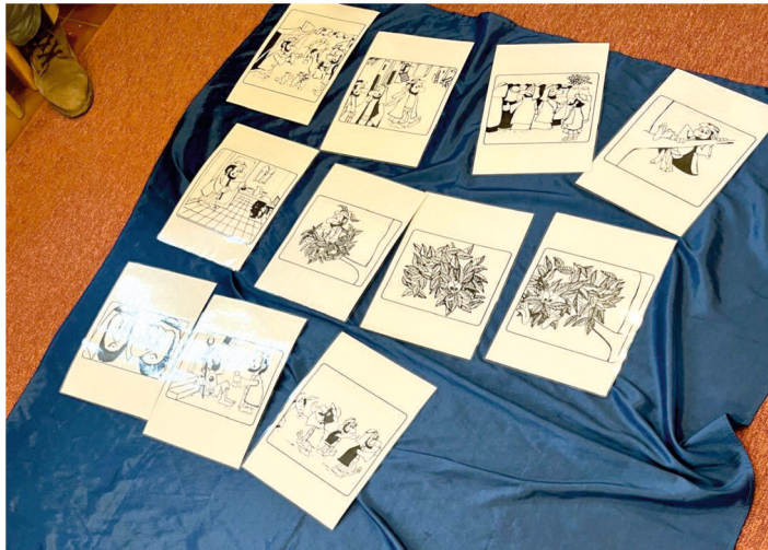
Die Geschichte von Zachäus aus der Familienzeit vom 31. März