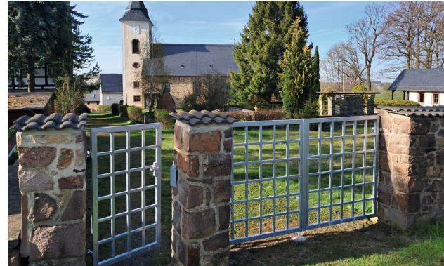
Neues Friedhofstor in Beerwalde