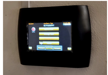
In der Mockritzer Kirche gibt es seit dem 7. Mai eine Entfeuchtungsanlage wie in Wendishain, um das Raumklima zu verbessern